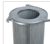
Jet3 & Jet4